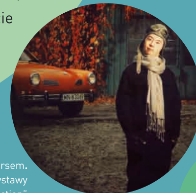
Fot. Oiko Petersem. Zdjęcie pochodzi z wystawy „Downtown Collection”

Dlatego chciałbym Was zaprosić na krótką, ale nietypową podróż – podróż po świecie osób z zespołem Downa.