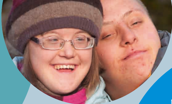
Zdjęcie pochodzi z wystawy „Down w 3D”

Nie wiem czy zdajecie sobie z tego sprawę, ale osoby z zespołem Downa towarzyszą nam od zawsze. Świadczyć o tym może ich obecność w sztuce na przestrzeni wieków. Co ciekawe, w sztuce ich obraz wydaje się być bardzo pozytywny – pozbawiony wielu uprzedzeń, tak charakterystycznych dla współczesnego świata.