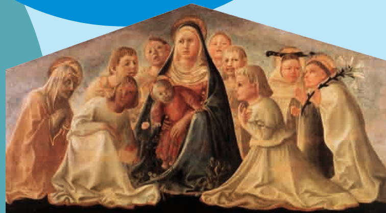
w obrazie Madonna Trivulzio Fra Filippo Lippi anioły mają cechy osób z zespołem Downa

03 Okres Renesansu to powrót do antycznych poglądów na temat piękna oraz harmonii ludzkiego ciała. Nie przeszkadzało to jednak renesansowym malarzom w umieszczaniu wizerunków osób niepełnosprawnych na swoich obrazach. Artyści nadawali cechy osób z zespołem Downa zazwyczaj postaciom boskim (wśród kilku obrazów Marii z Dzieciątkiem Andrei Mantegni można zobaczyć małego Chrystusa o obliczu dziecka z zespołem Downa) lub posiadające bezpośredni kontakt z boskością (np. w obrazie Madonna Trivulzio Fra Filippo Lippi anioły mają cechy osób z zespołem Downa). Trudno wytłumaczyć fascynację renesansowych malarzy osobami upośledzonymi umysłowo, jednak można wysnuć hipotezę, że wynika ona z postrzegania osób z zespołem Downa jako istot zawsze niewinnych, co w połączeniu z ówczesnym powszechnym mniemaniem o ich wyjątkowej naturze powodowało, iż dla malarzy byli postaciami pięknymi i wartymi sportretowania.